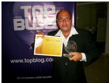
Top Blog 2012/2013